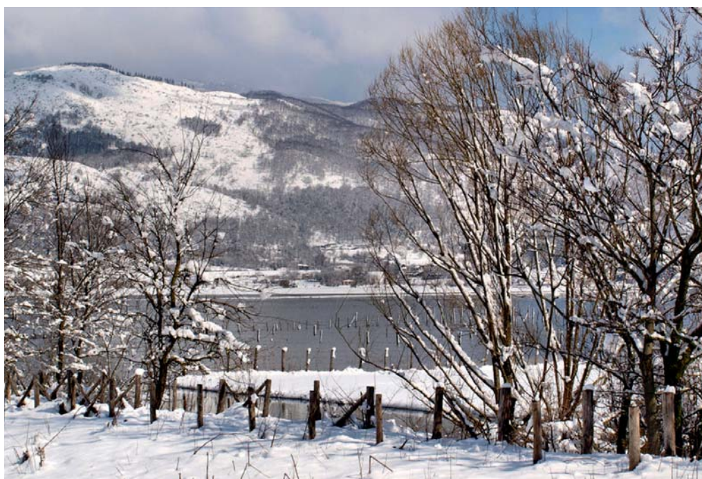
Sopra: Piana del Dragone / Sotto: Piana del Dragone Innevata.